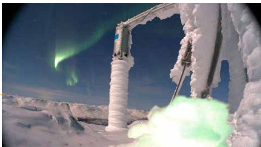
Ismåling på Svartfoss i Nordreisa kommune utført av Kjeller vindteknikk som en del av mulighetsstudien. Foto er fra kamera på måleutstyret februar 2025.

Det er gjennomført et mulighetsstudie for å kartlegge potensialet for vindkraft i kommunene Storfjord, Kåfjord, Nordreisa og Kvænangen. Arbeidsgrupper med representanter fra kommunene, reinbeitedistrikter, lag og foreninger har deltatt i prosessen for å sikre bred involvering.