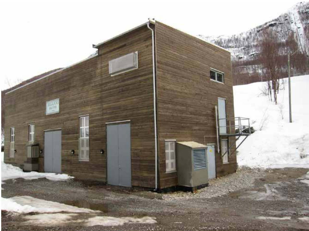
Sikkajökk kraftverk i Rotsundelv, Nordreisa kommune. Idriftsatt i 1950.

Kraftverkene i Čorrojávrit, Kvænangsbotn, Lássajávri og Småvatna i Kvænangen samt Sikkajökk i Nordreisa er vurdert som kulturminner av nasjonal betydning og er listeført i NVEs oversikt over verneverdige anlegg. Dette innebærer at anleggene er vurdert som kulturhistorisk verdifulle og skal tas særskilt hensyn til i forvaltningen. Selv om listeføringen ikke gir automatisk lovfestet vern, betyr den at NVE legger vekt på anleggenes nasjonale betydning når det behandles saker som gjelder endringer eller oppgraderinger.