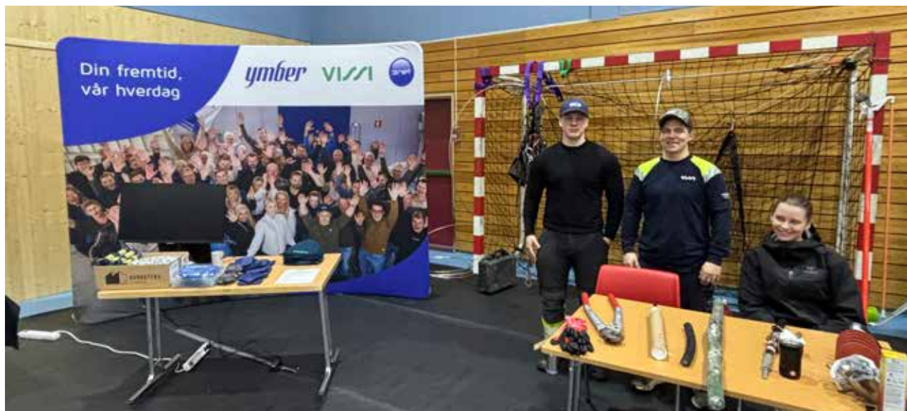
Ymberkonsernet deltar årlig på yrkes- og utdanningsmessene som arrangeres på Storslett og i Nordkjosbotn.

Ymberkonsernet jobber aktivt med å tiltrekke seg nye flinke og kompetente medarbeidere som kan være med på å løfte konsernet inn i bærekraftig fremtid. Ymber har opprettet en egen Karriereportal ( karriere.ymber.no ) som er en nettside der informasjon om kompetanse og ledige stillinger i konsernet er samlet.