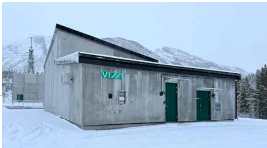
Vinnelys 66 kV koblingsstasjon.

Den nye koblingsstasjonen inngår som et sentralt knutepunkt i regionalnettet og styrker forsyningsikkerheten i regionen samt legger til rette for fremtidig utvikling av strømmettet i Nord-Troms. Anlegget er bygget i tett samarbeid med Statnett.