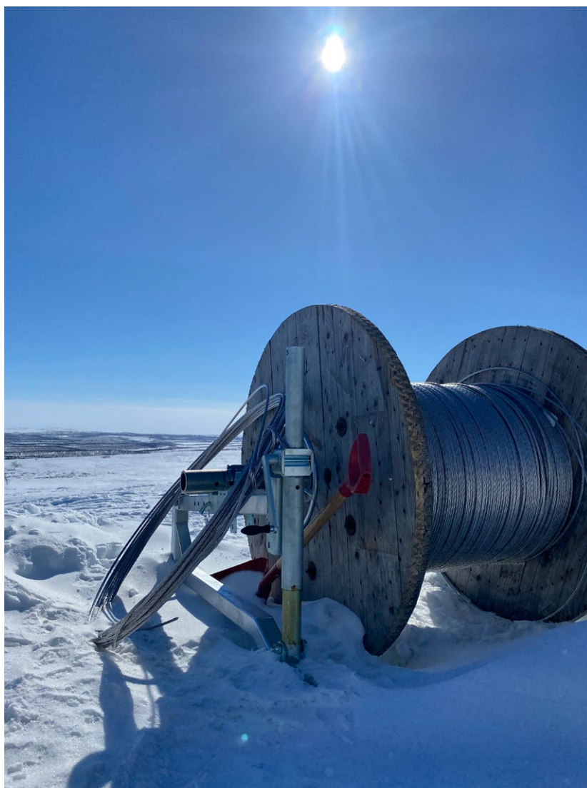
Trådkifte Veardnas Kautokeino.