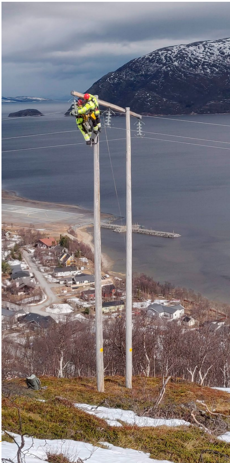
Bytte av oppheng 66kV.

I 2022 ble det ansatt en kvinnelig energimontør i tillegg til at en av de nye energimontørlærlingene er kvinne. Konsernstyret består pr. 31.12.2022 av 43% kvinner. Det anses ikke nødvendig med iverksetting av særskilte tiltak utover tiltak som kan gjøres gjennom fremtidige ansettelser og lignende.