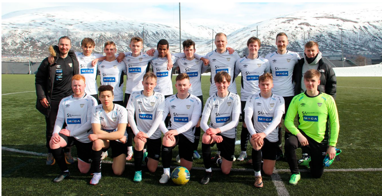
Ymber har vært en støttespiller til Nordreisa IL og har også hatt stadion navnet Ymber Arena i mange år. Bildet er av A-laget til Nordreisa IL.

Gjennom å støtte lokale lag og foreninger (ideelle organisasjoner, kulturorganisasjoner, idrettslag og lignende) får Ymber-konsernet profilert selskapene på en god måte i hele forsyningsområdet. Noen av dem som er sponset i 2022 er Riddu Riddu Barnefestival, Skjervøy IK, Kautokeino Sportsskytterklubb, Samisk Påskefestival, og Nordreisa IL. I tillegg profilerer konsernet seg gjennom lokale media, yrkes- og utdanningsmessa, stipendutdeling, Newtonrommet, First Lego League, med mer.