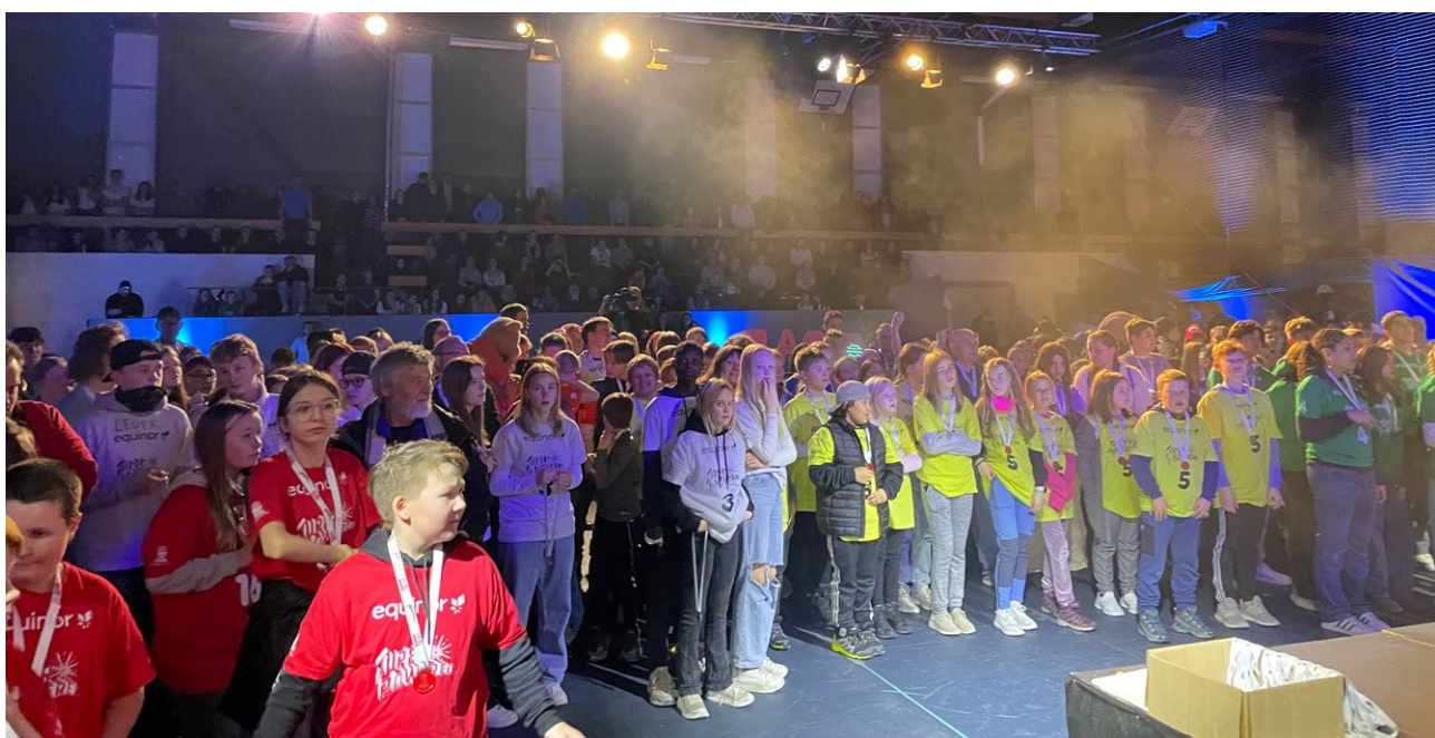
Ymber støttet First Lego League i oppstartsåret 2022 på Skjervøy, og det ble en stor suksess.