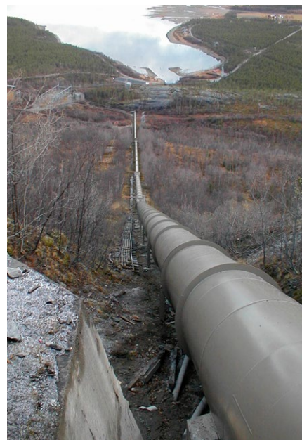
Rørgata ned mot kraftverket i Kvæningsbotn.