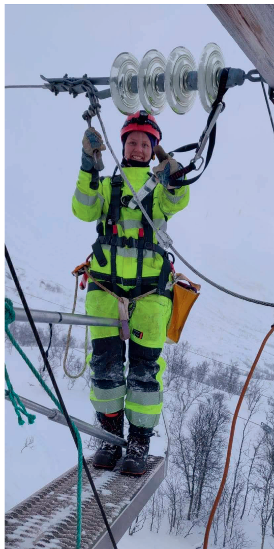
Vår kvinnelige lærlingmontør i arbeid.

Konsernstyret består pr. 31.12.2021 av 57 % kvinner. Det anses ikke nødvendig med iverksetting av særskilte tiltak utover tiltak som kan gjøres gjennom fremtidige ansettelser og lignende.