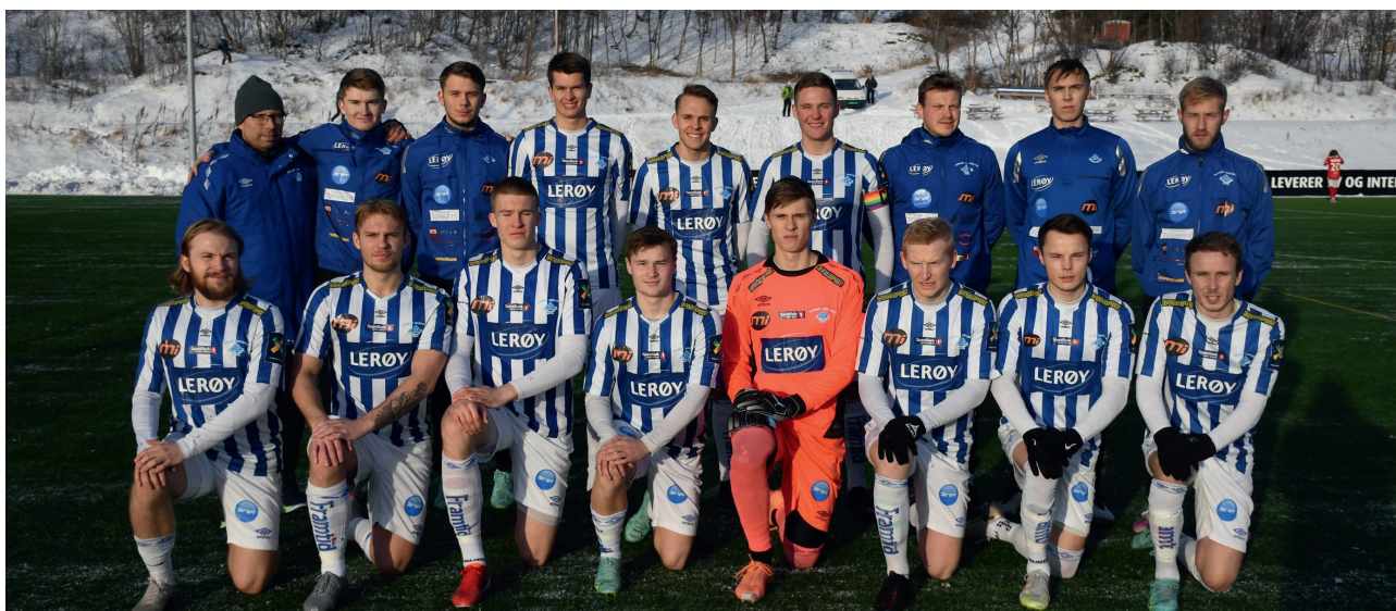
Ymber har vært en støttespiller til Skjervøy IK Fotballgruppa og Skigruppa i flere år og her er bildet fra A-laget.

Gjennom å støtte lokale lag og foreninger (ideelle organisasjoner, kulturorganisasjoner, idrettslag og lignende) får Ymber-konsernet profilert selskapene på en god måte i hele forsyningsområdet. Som følge av korona har det vært redusert aktivitet i 2021, men Ymber har likevel støttet lokale lag og foreninger. Noen av dem som er sponset i 2021 er Skjervøy IK, Kautokeino Sportsskytterklubb og Nordreisa IL. I tillegg profilerer konsernet seg gjennom lokale media og i den årlige kundekalenderen.